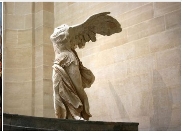
Inconnu La Victoire de Samothrace II e ème siècle avant JC

Ça grenouille dans les Enfers, enfin un peu de comédie – Emission Radio Quand les Dieux rôdaient sur la terre, France Inter, Pierre Judet de la Combe, 2024