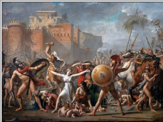
Jacques Louis David Les Sabines 1799