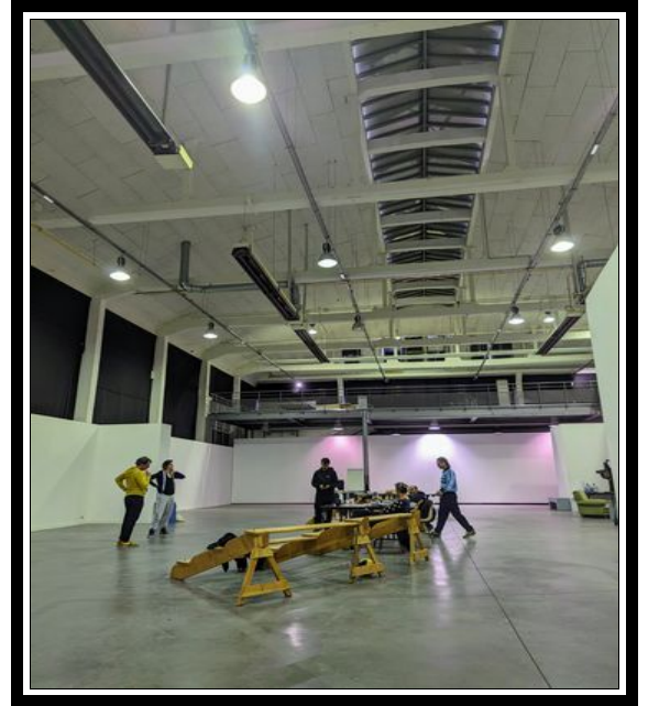
Photo issue de recherches au plateau / Laval / 2023